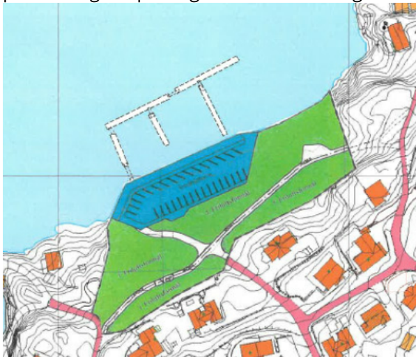
Nytt forslag til småbåthamn

Framlagde, justerte løysing er flytta nærmare inn mot land, gjort smalare, og med molo som går om lag parallelt med strandlinja på staden. Det er planlagt å sprengje ei fjellhulle på minus 10 meter på sjøbotnen, som fundament for moloen. Den nye løysinga vil framleis krevje sprenging i strandsona, med fjellskjering i snitt på 3-4 meter høgde og 5,5 meter på kortare parti. Fjellskjering i førre planforslag var planlagt med mellom 5 og 12 meter høgde.